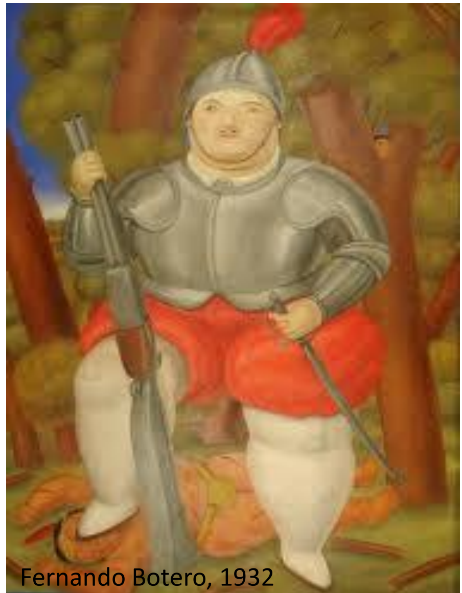
Fernando Botero, 1932