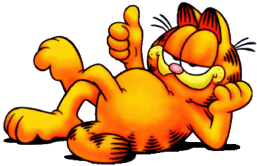
...Λαζάνια & Τεμπελιά