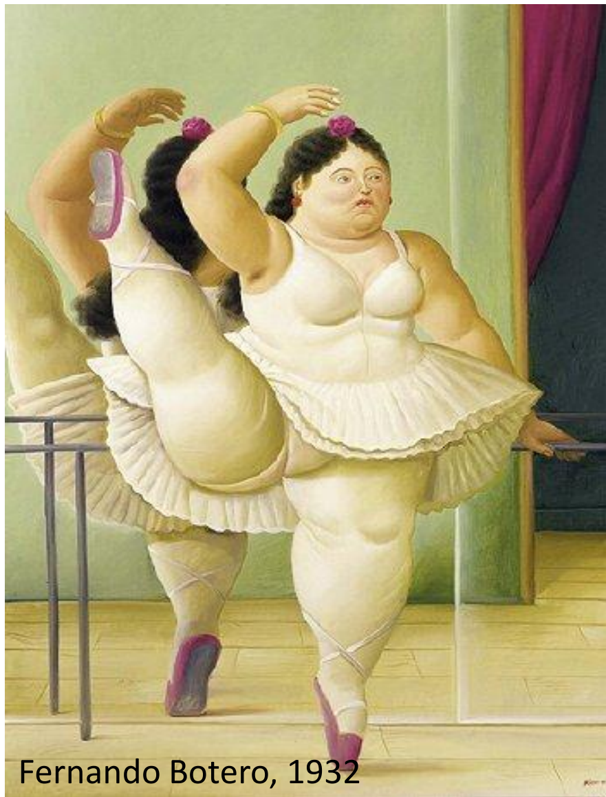
Fernando Botero, 1932