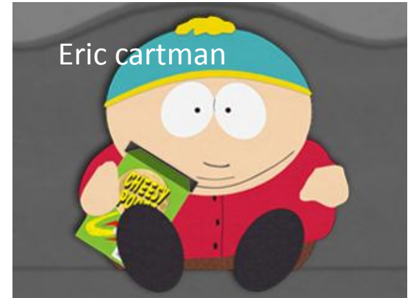
.....Πατατάκια & KFC